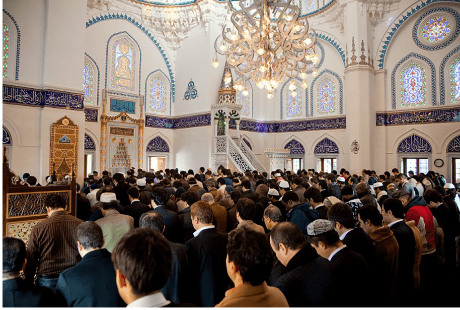
Tokyo Camiinde Cuma Namazı

kurtarmak amacını da güden derneğin Çin, Afganistan, Türkiye ve Hindistan'da şubeleri açılmıştır. 51