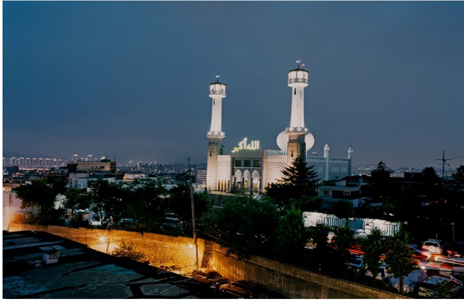
1976’da açılan Seul merkez Camii (Güney Kore)